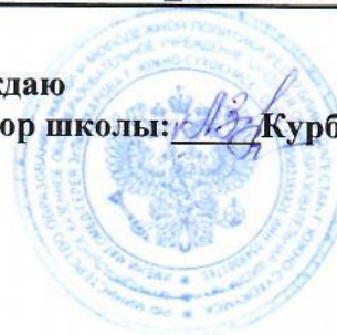
График проведения уроков с применением автогородка в МКОУ СОШ №1 им. Магомед-Герее Зульпукарова на 2021-2022 учебный год