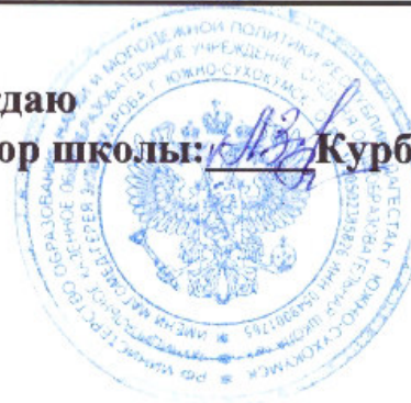
График проведения уроков с применением автогородка в МКОУ СОШ №1 им. Магомед-Герее Зульпукарова на 2019-2020 учебный год